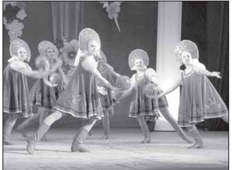
Ансамбль эстрадно-спортивного танца «Зодиак».

Ребята, занимающиеся в нашем Центре творчества, приходят в его стены с огромным удоволь-