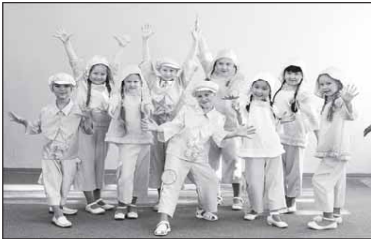
Вокальный ансамбль «Вдохновение», младшая группа.